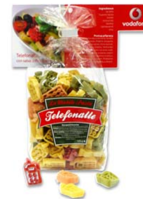
POPAI CENTRAL EUROPE AWARDS 2009