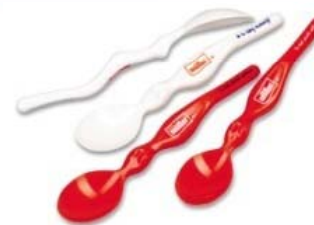
1. místo Hvězda 3DR 2009 Plastová lžička ve tvaru ženského těla Müller