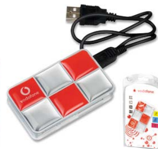
Hvězda 3D reklamy 2009

2.místo – kat. Reklamní dárek přibalený ke zboží