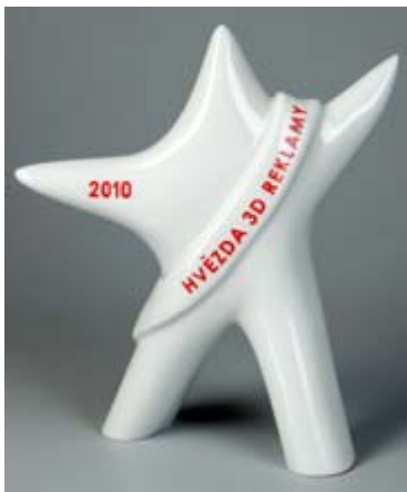
1. místo Hvězda 3DR 2010 Chladicí podložka pod notebook Vodafone

např.: plastelína chameleon Vodafone, tvořítko na led Oriflame, antistres králik Vodafone.