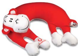
Hvězda 3D reklamy 2009