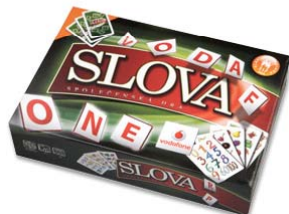
1. místo Hvězda 3DR 2010

2.místo – kat. Reklamní a dárkové předměty pro sport, hobby a volný čas