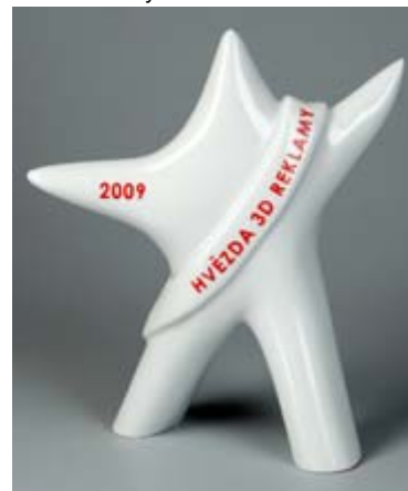
1. místo Hvězda 3DR 2009 Stojánek na mobilní telefon do zásuvky Vodafone