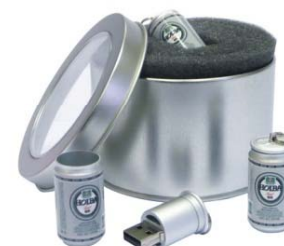
1. místo Zlatá koruna 2009 USB flash disk ve tvaru plechovky piva Holba

Soutěž patří mezi vrcholné události oboru a prezentuje nejnovější prostředky in-store komunikace, systémy podpory prodeje a další podpůrné propagační nástroje. Je součástí soutěže POPAI EUROPEAN AWARDS.